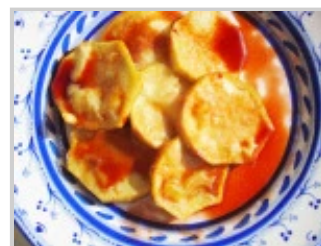
Batata con Cotto di melacotogna