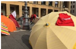
Gli ombrelloni disposti lungo l'ovile della piazza leccese